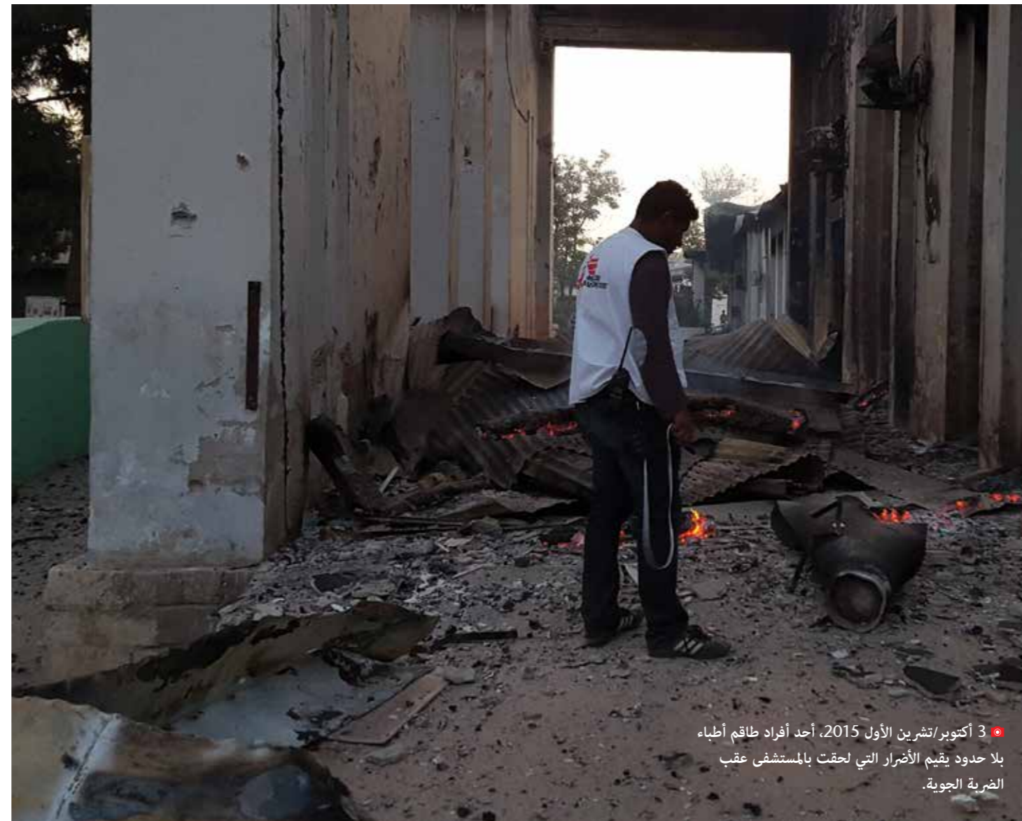
● 3 أكتوبر/تشرين الأول 2015، أحد أفراد طاقم أطباء بلا حدود يقيم الأضرار التي لحقت بالمستشفى عقب الضربة الجوية.