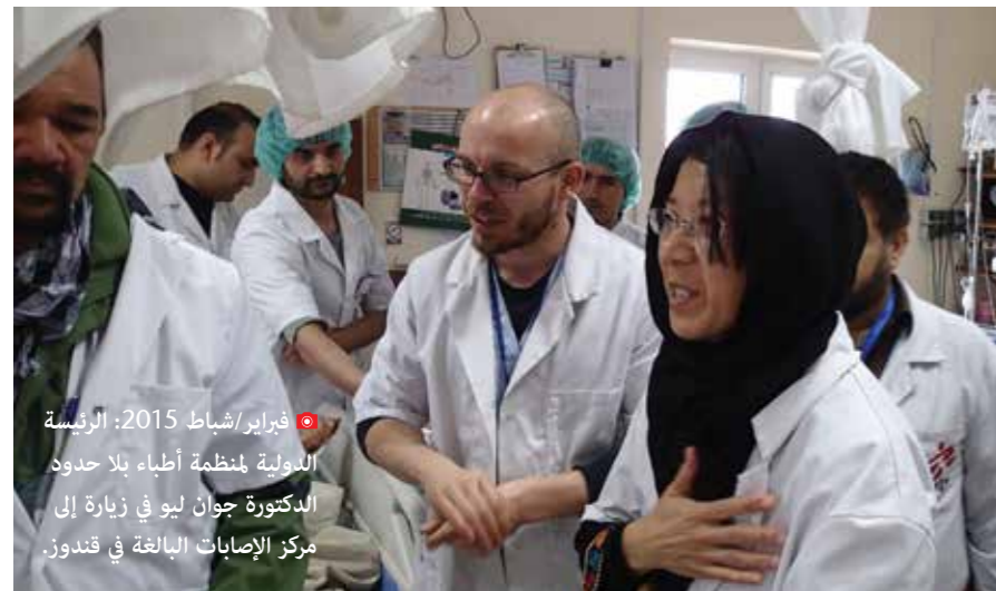
● فبراير/شباط 2015: الرئيسة الدولية لمنظمة أطباء بلا حدود الدكتورة جوان ليو في زيارة إلى مركز الإصابات البالغة في قندوز.

ما من كلمات تسعفني لوصف الرعب الذي عم المكان، فقد كان ستة مرضى داخل وحدة العناية المركزة يحترقون على أسرتهم لويوش زولتان بيتش، ممرض يعمل مع منظمة أطباء بلا حدود