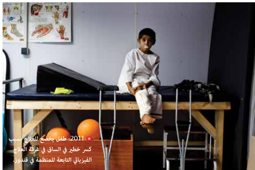
● 2011: طفل يخضع للعلاج بسبب كسر خطير في الساق في غرفة العلاج الفيزيائي التابعة للمنظمة في قندوز.